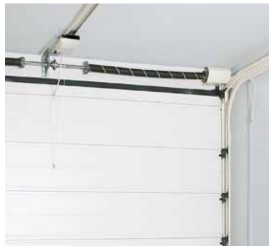
Vista interna porta sezionale New Age con automazione centrale a traino S/550.

In tutte le automazioni Ballan il dispositivo di limitazione delle forze, interrompe - e inverte - il movimento in presenza di un ostacolo (sforzo massimo consentito 400 N). L'azione del limitatore di sforzo è evidenziata dalla linea blu nel grafico, ben al di sotto di quelli stabiliti per legge (linea rossa).