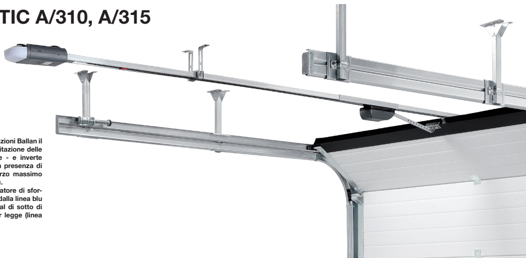
Vista interna porta sezionale ONDA con automazione sistema a traino Automatic A/310.

In tutte le automazioni Ballan il dispositivo di limitazione delle forze, interrompe - e inverte - il movimento in presenza di un ostacolo (sforzo massimo consentito 400 N). L'azione del limitatore di sforzo è evidenziata dalla linea blu nel grafico, ben al di sotto di quelli stabiliti per legge (linea rossa).