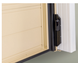
Coppia di fotocellule interne precablate e premontate sulla porta basculante. (optional)