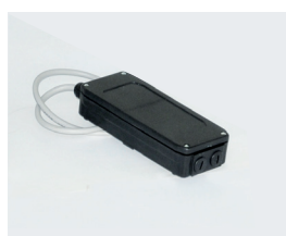
Ricevente esterna a basso consumo 2/4 uscite a 1000 utenze con scheda per il Back-up inclusa. Per utilizzo su automazioni esistenti in loco si consiglia di prevedere l'antenna aggiuntiva. (optional)