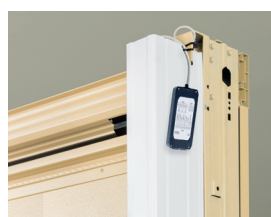
Posizione a dx vista interna della scheda esterna per il cablaggio degli accessori.