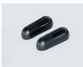
Fotocellule aggiuntive sfuse, da parete no ad incasso. (optional)