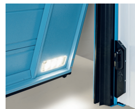
Coppia di luci a led, ad alta intensità, installate all'interno nella parte inferiore dell'anta mobile e precablate, adatte per illuminare la zona di transito durante la manovra. (optional)