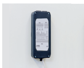
Scheda accessori connessa alla VISg tramite cavo Bus. (optional)