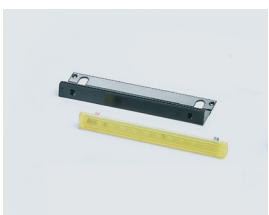
Lampeggiante a led esterno, con antenna integrata, montato e precablato. (optional)