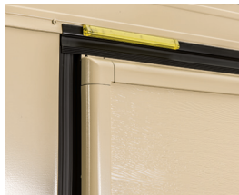
Posizione lampeggiante a led, per posa in luce, posto in esterno sulla traversa superiore. (optional)