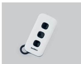
Trasmettitore Smart, FM rolling code a 3 e 5 canali.

Viene fornito già installato nella porta. Disponibile in due soluzioni: - Contatto N.C. opzionale solo con porta basculante motorizzata. - Contatto N.C. opzionale per porta pedonale (con porta basculante manuale o motorizzata).