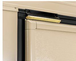
Posizione lampeggiante a led, con supporto per posa oltre luce, posto in esterno sulla traversa superiore. (optional)