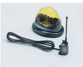
Lampeggiante di movimento 24 V, con antenna per radiocomandi. (optional)