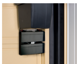
Batterie tampone 12 V per il funzionamento della basculante in caso di mancanza di tensione di rete. (optional)