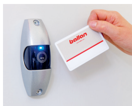
Letto badge completo di scheda bicanale con blindatura, viene fornito con tessera master e alimentazione tramite cavo. (optional)