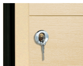
Il dispositivo di sblocco esterno contro il rischio black out. (optional)