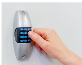
Tastiera a codice retro illuminata completa di scheda bicanale con blindatura. Alimentazione tramite cavo. (optional)