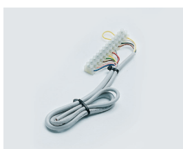
Morsetti per cablaggio lampeggiante e antenna posizionata sempre in alto a dx vista interna. (optional)