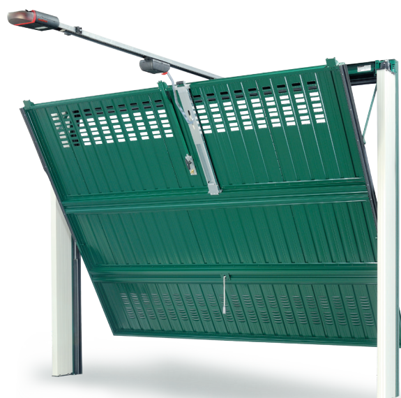
Vista interna Zink Spazio HF con automazione a soffitto RUN Ballan.

N.B.: La Ballan SpA si riserva la facoltà di apportare, senza preavviso, modifiche ai prodotti. Le caratteristiche tecniche possono variare nel caso di applicazioni particolari. Per altre esigenze interpellare l'ufficio tecnico Ballan.