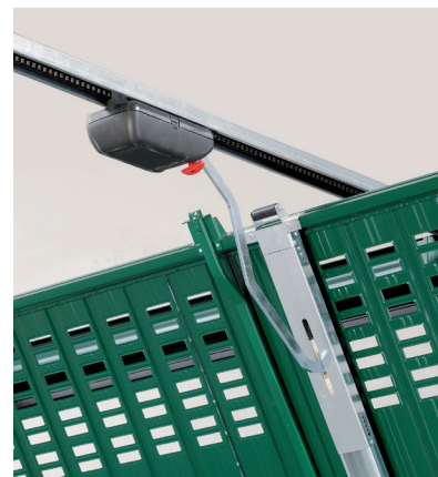
Automazione a soffitto RUN Ballan. Il gruppo attuatore con pattino, il braccio di spinta sagomato e la guida in acciaio del motore sono sempre zincati.

In tutte le automazioni ERG Ballan il dispositivo di limitazione delle forze, interrompe e inverte il movimento in presenza di un ostacolo (sforzo massimo consentito 400 N). L'azione del limitatore di sforzo è evidenziata dalla linea blu nel grafico, ben al di sotto di quelli stabiliti per legge (linea rossa).