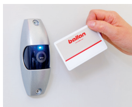
Letture badge completo di scheda bicanale con blindatura, viene fornito con tessera master e alimentazione tramite cavo. (optional)