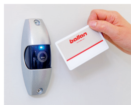
Letto badge completo di scheda bicanale con blindatura, viene fornito con tessera master e alimentazione tramite cavo. (optional)