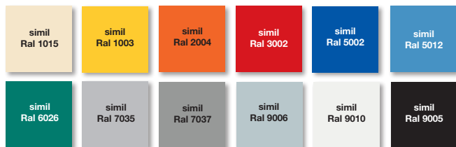
Tinte standard telo.

struttura autoportante e precablaggio con connettori rapidi senza carter coprirotolo e motore