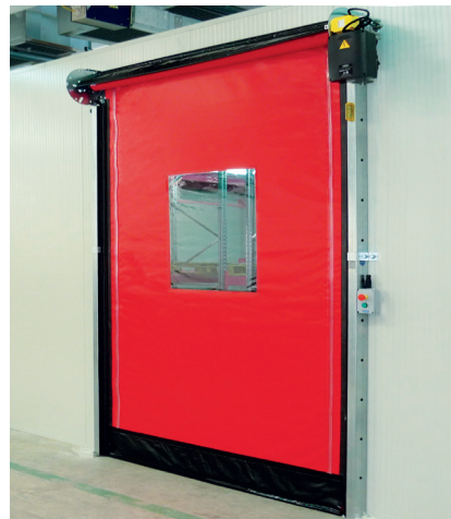
Portone rapido Eolo Interior.