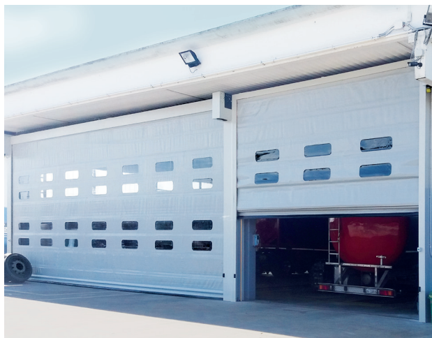
Portone rapido Eolo Impac.