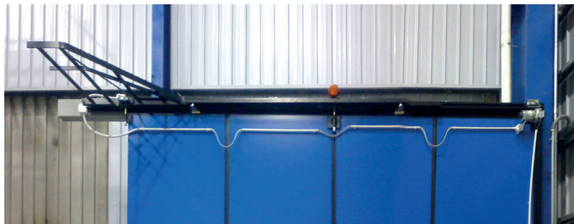
Vista interna portone a libro Anteo con motorizzazione meccanica a cremagliera completa di motore 24 V, installato su anta.

Il materiale deve sempre essere installato da personale specializzato e secondo le normative vigenti.